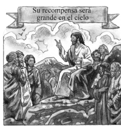
© J. & P. Polak Co., Inc.

San Mateo representa a Jesús como uno que encarnaba estas Bienaventuranzas. El poseía las cualidades del alma que sus seguidores también podrían poseer.