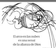
El arco en las nubes es una señal de la alianza de Dios

Dios ama a cada uno de nosotros personalmente. En su discurso inaugural, el Papa Benedicto XVI dijo: "No somos algún producto casual sin sentido de la evolución. Cada uno de nosotros es el resultado de un pensamiento amoroso de Dios. Cada uno de nosotros es querido, cada uno es amado y cada uno de nosotros es necesario. El amor de Dios es tan grande que dentro de cada uno de nosotros esta un anhelo de seguir y conocer el significado de nuestras vidas y comprender los misterios de la vida. Cuando tomamos el tiempo para entrar en estos misterios, estamos luchando por conocer a Dios. Durante estos cuarenta días de Cuaresma, Jesús nos invita como pueblo del nuevo pacto, para pasar más tiempo con él. ¿Aceptaremos la invitación para ir al desierto con Jesús? Ahora es el tiempo aceptable! Las primeras lecturas los Domingos de Cuaresma del Antiguo Testamento nos ayudan a conocer a Dios a través de sus pactos con los Israelitas. En la historia de hoy el Pacto de Noé y el diluvio, el arco en el cielo es una señal divina que Dios nunca utilizará las aguas para destruir la vida mortal nuevamente.